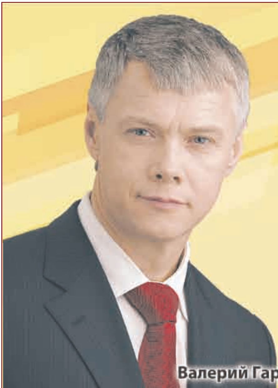
Валерий Гартунг, лидер ЧРО партии СПРАВЕДЛИВАЯ РОССИЯ