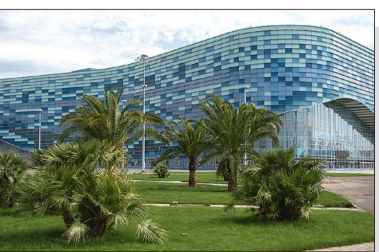
Дворец зимнего спорта «Айсберг» – одно из самых грандиозных спортивных сооружений, построенных для Олимпиады-2014. Всего в Сочи было возведено более 50 объектов, почти половина из которых находится сегодня в частной собственности.

Фракция партии СПРАВЕДЛИВАЯ РОССИЯ сделала все возможное, для того чтобы не допустить принятия этого закона. Мы убедили другие оппозиционные партии проголосовать против его принятия, вернули в процедуру принятия законопроектов норму об обязательном про-