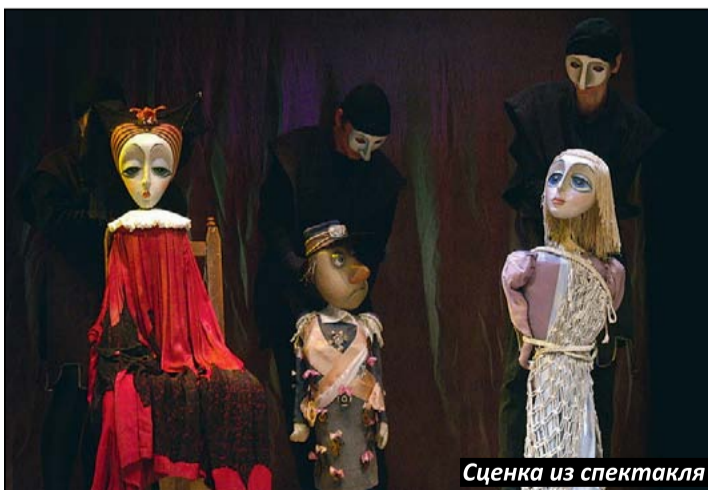
Сценка из спектакля

отличную учёбу, для ребят из многодетных и малообеспеченных семей – долгожданный подарок, которого наверняка ждут. Спасибо фонду, спасибо артистам, подарившим нашим малышам отличный летний старт.