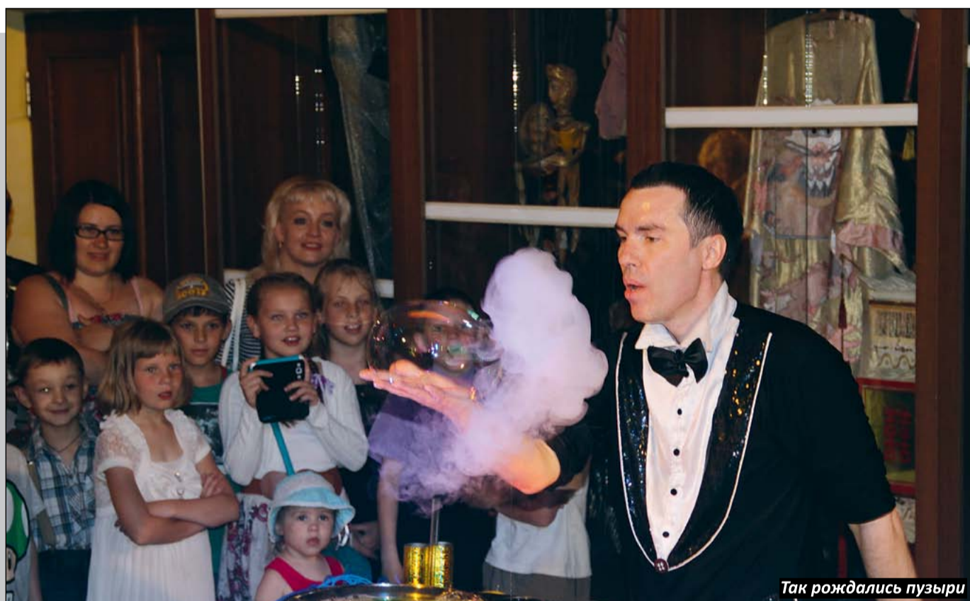
Так рождались пузыри