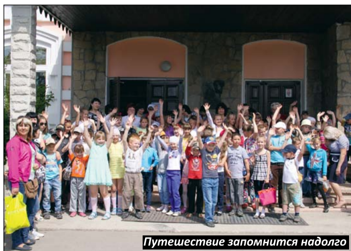
Путешествие запомнится надолго