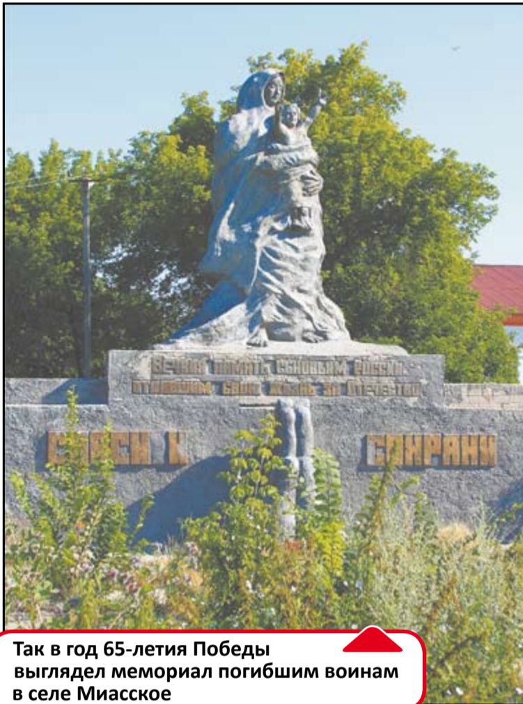
Так в год 65-летия Победы выглядел мемориал погибшим воинам в селе Миасское

Оглянитесь! Если в вашем городе, поселке, районе или деревне есть памятник павшим героям войны, расскажите нам о нем, сделайте снимки, напишите о тех, кто следит за мемориалом. Сообщите также и о том, если с обелиска сошла краска, если площадка вокруг него заросла бурьяном, если на табличке не разобрать имена павших солдат. Будем помнить о тех, кто нас защищал!