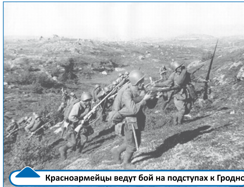
Красноармейцы ведут бой на подступах к Гродно

Одним из первых соединений, принявших на себя удар немецких войск 22 июня 1941 года в районе города Гродно (Белоруссия), была 85-я стрелковая ордена Ленина Челябинская дивизия. Она входила в состав 3-й армии Западного особого военного округа.