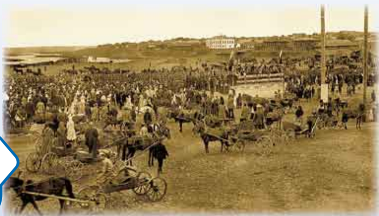
Сенная площадь Челябинска, где шла активная торговля продовольствием, в том числе и картофелем.

Куртамышевской, Каменской и других волостях Челябинского уезда, в котором взбунтовалось около 40 тысяч крестьян. На подавление восстания правительство послало войска – около 10 тысяч человек пехоты и конницы в сопровождении артиллерийских орудий. Только в Челябинском уезде восставших усмиряли почти неделю. Более 700 наиболее активных бунтовщиков были отправлены в челябинскую тюрьму. Десятки зачинщиков сослали на каторгу, многие арестованные умерли в тюрьме от ран. Примечательно, что после подавления бунта в Челябинском уезде картофеля было посажено втрое больше, чем в предыдущие годы. Второй хлеб стал для жителей Южного Урала вполне обычным продуктом.