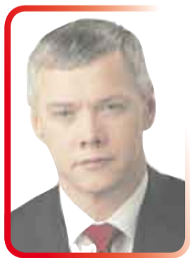
ВАЛЕРИЙ ГАРТУНГ, депутат Государственной Думы РФ:

суждали 83-й закон. Я думал, что к обязательным дисциплинам отнесут русский язык, литературу, математику, физику и историю, но никак не ОБЖ, физику и «Россию в мире».