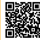
Инфографика А. Серебряковой

ЗАЩИТА ПАЦИЕНТОВ ИНТЕРНАТОВ И ДОМОВ ПРЕСТАРЕЛЫХ