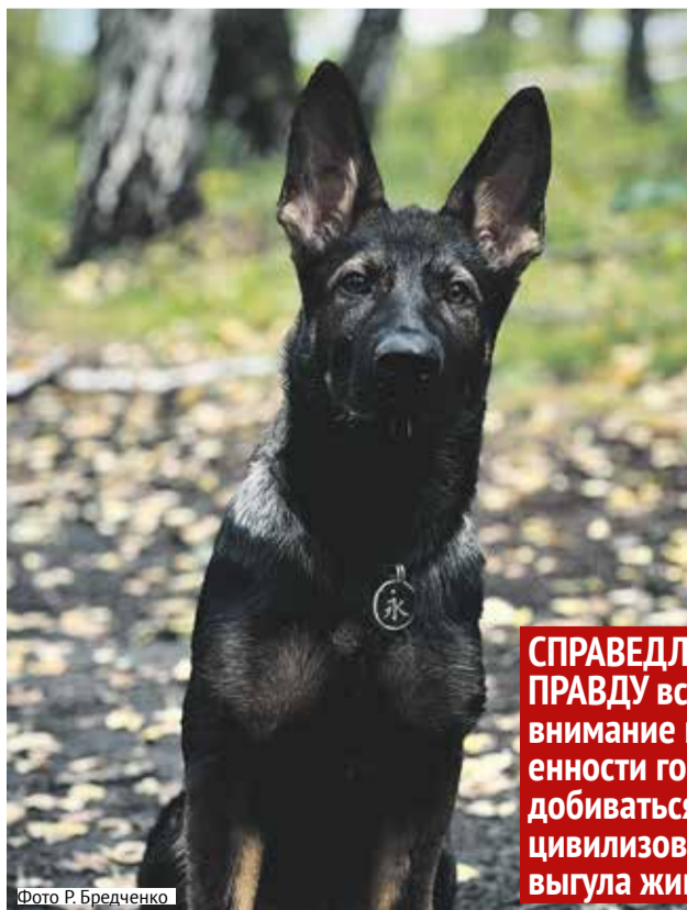
Фото Р. Бредченко

Справедливоросс Роман Бредченко предлагает, как решить проблему цивилизованного выгула собак в городах.