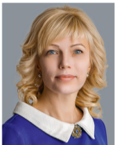
Ольга Мухометьярова, депутат Законодательного собрания Челябинской области:

Подумайте об этом. Приходите на выборы. Голосуйте сознательно и обдуманно!