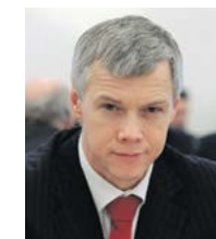
Валерий ГАР-ТУНГ, депутат Государственной Думы:

В конце февраля фракции и комитеты Госдумы представляли свои предложения по реализации инициатив, озвученных в послании президента. СПРАВЕДЛИВОЙ РОССИИ было легче всего это сделать, потому что на протяжении всего срока парламентской деятельности справедливороссы вносили законы, прямо соответствующие социальным инициативам президента.