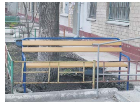
▲ Некоторые дворы благоустроены действительно по-единороссовски

Кстати, заявки на благоустройство двора можно подать и в региональном отделении СПРАВЕДЛИВОЙ РОССИИ: Челябинск, пр. Ленина, 83, оф. 310 б, телефон 265 55 22. Здесь же можно написать жалобу, если Ваш двор благоустроили некачественно.